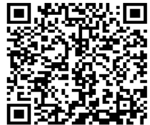
第61回東京消化器内視鏡看護勉強会